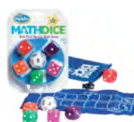
Math Dice Jr.