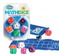
Math Dice Jr.